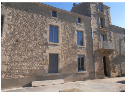
Façade arrière de la mairie

Ainsi, les travaux de réhabilitation de la mairie avancent normalement et pourront s'achever comme prévu fin juin – début juillet 2018.