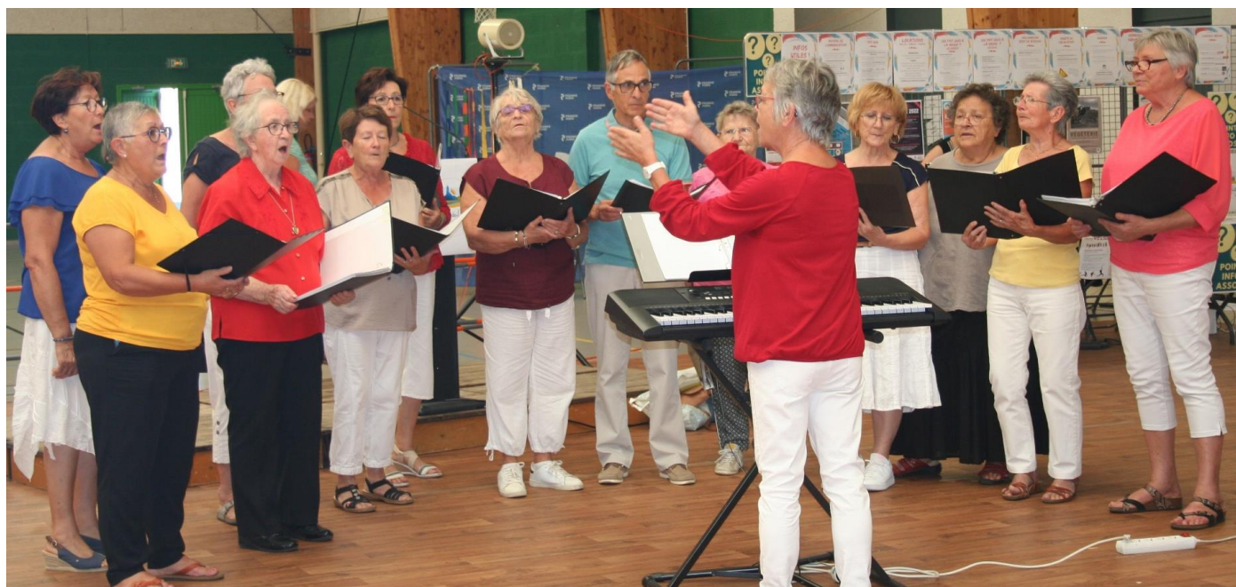
Une partie de la chorale la Croche Chœur au forum des associations du 3 septembre 2022

En attendant, que vous soyez chanteur ou que vous ayez quelques prédispositions pour la musique, que vous soyez débutant ou confirmé, sachez que La Croche Chœur est prête à vous accueillir dans l'une de ses sections.