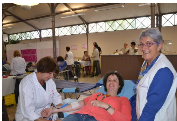
Les bénévoles donnent aussi leur sang