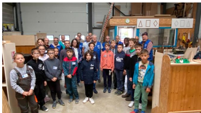
Effectif de la saison 2022-2023

Une initiative humaine où deux générations se rencontrent et collaborent à une même activité.