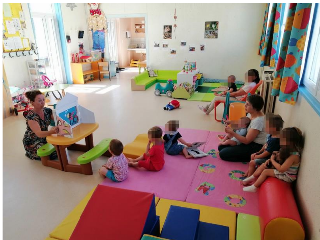
Nouveauté 2022 : le Kamishibai

C'est un lieu original de jeux, de rencontres, d'échanges et de convivialité. Il permet une socialisation en douceur aux enfants de 0 à 3 ans, avant l'entrée à l'école sous le regard bienveillant du parent, grand-parent ou assistante maternelle qui l'accompagne. Une accueillante, bénévole de l'association, est présente à chaque permanence.