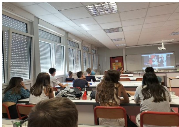
Intervention au collège