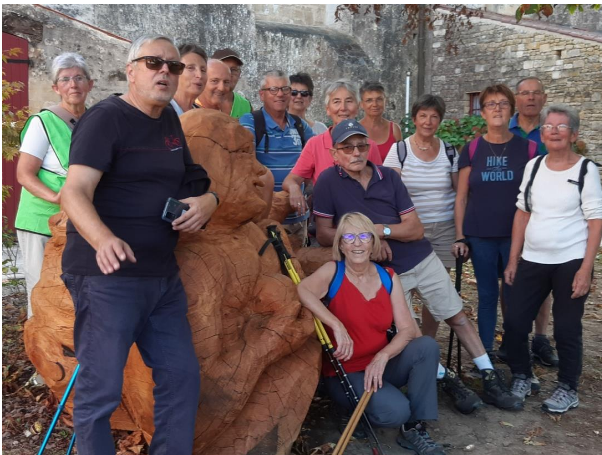
Randonnée à Fousais-Payré