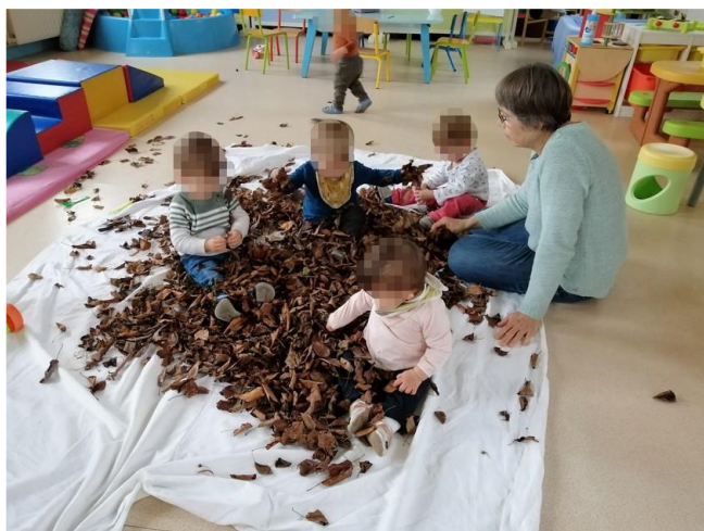
Jouer dans les feuilles mortes