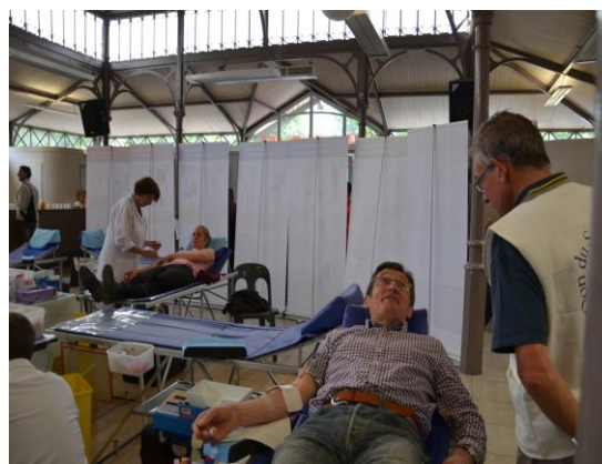
Salle de collecte